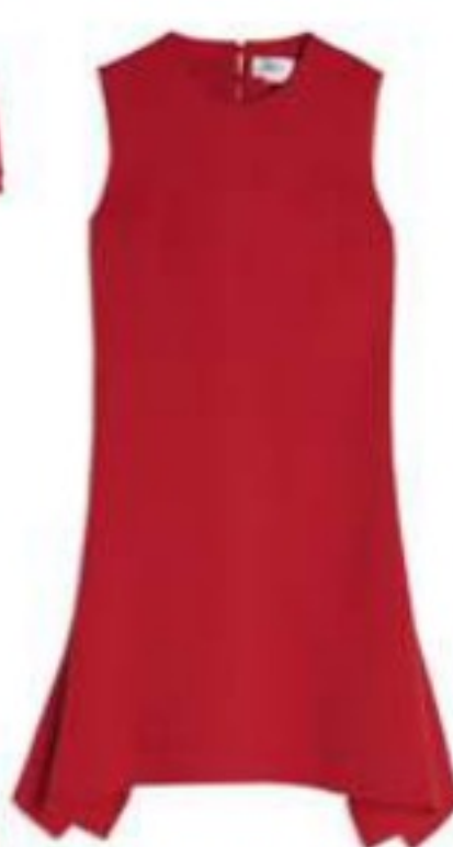
VICTORIA BY VICTORIA BECKHAM ₺4499