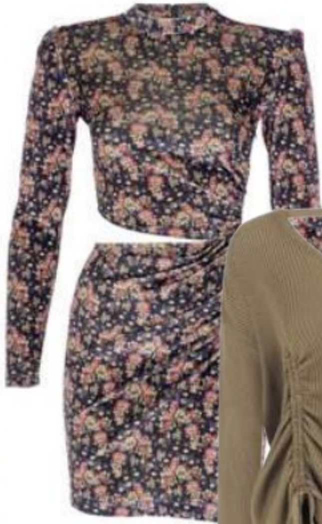
HOUSE OF GIZU ₺950