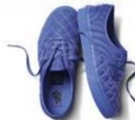
VANS X OPENING CEREMONY ₺829