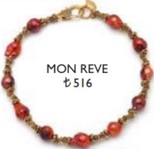
MON REVE ₺516