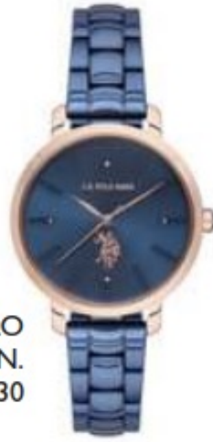
U.S. POLO ASSN. ₺1030