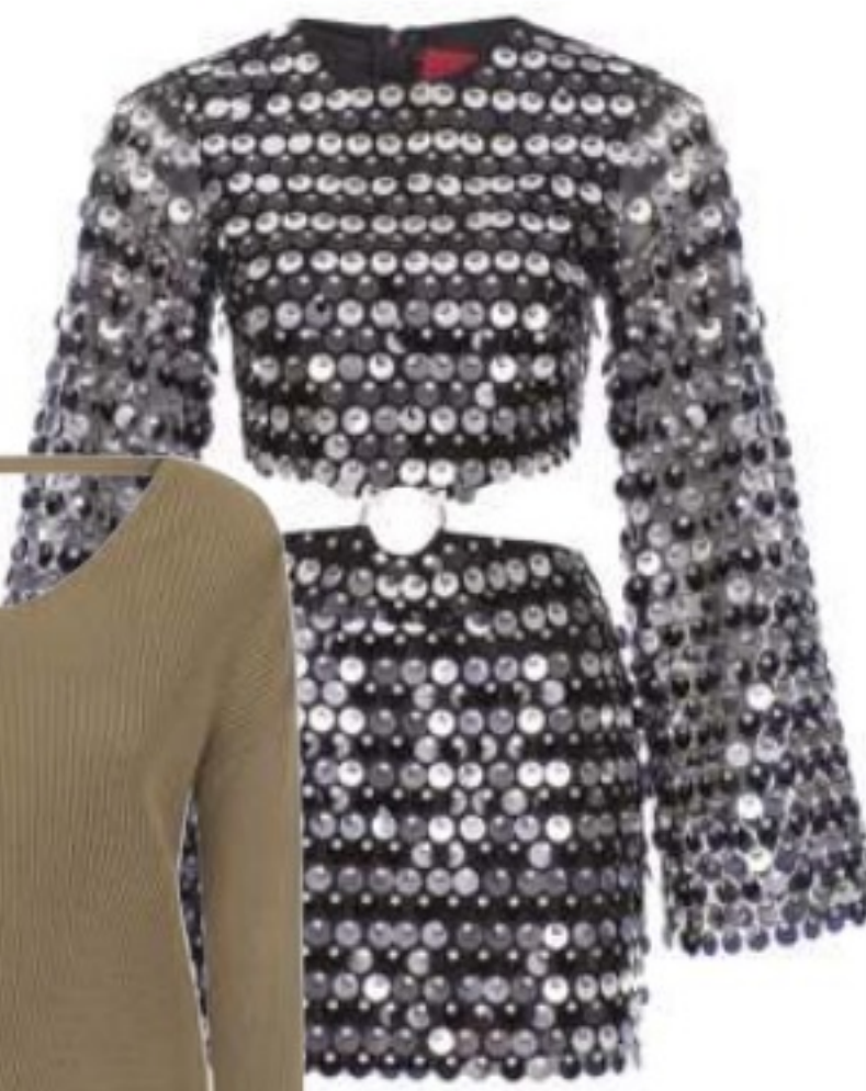
NEW ARRIVALS ₺2799