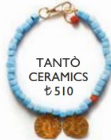
TANTÒ CERAMICS ₺510

Her tonu ile 'cool' tek renk mavi, ilkbahar-yaz sezonunda her parçaya dokunuyor.