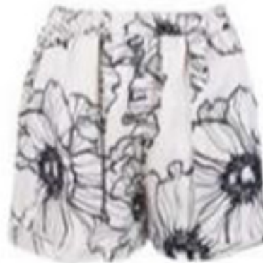
NİSSE ÜST ₺ 695 ALT ₺ 1740