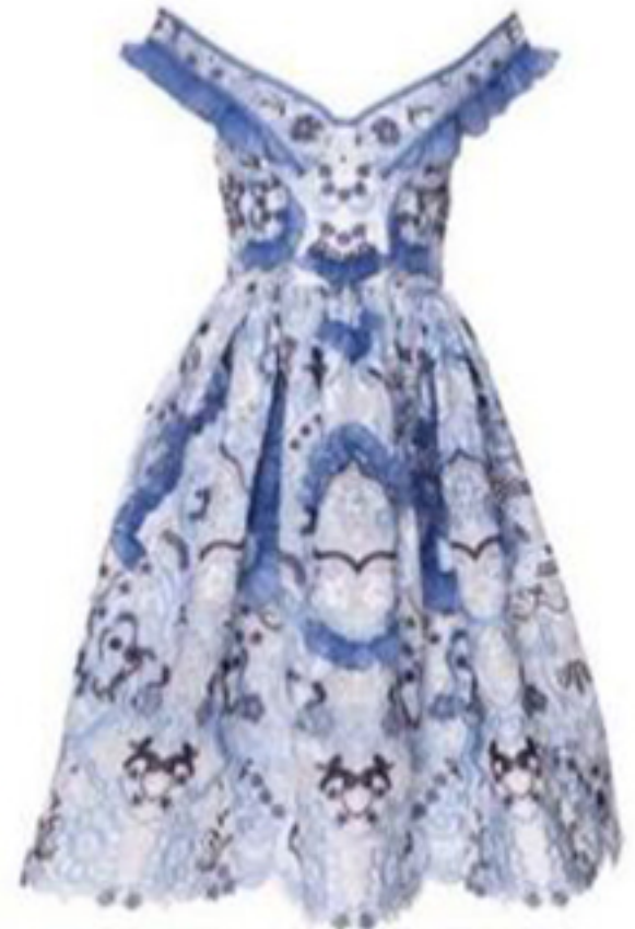
ZEYNEP TOSUN (GIZIA GATE) ₺ 5400