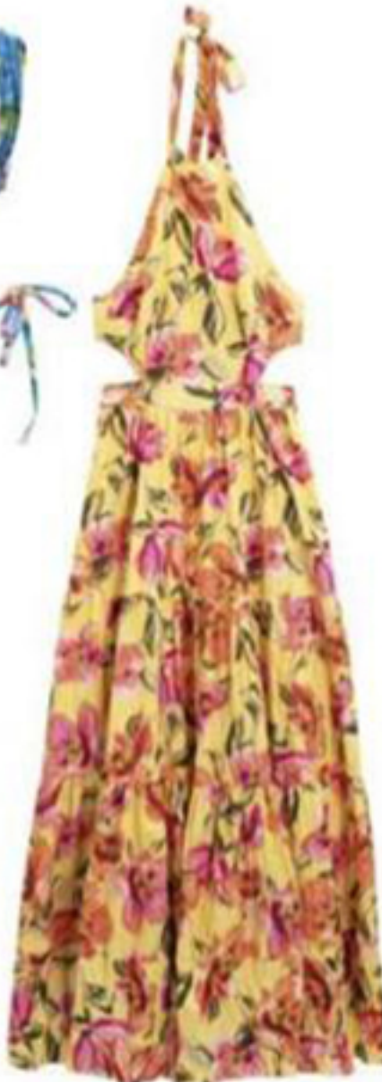
KOTON ₺ 269.99