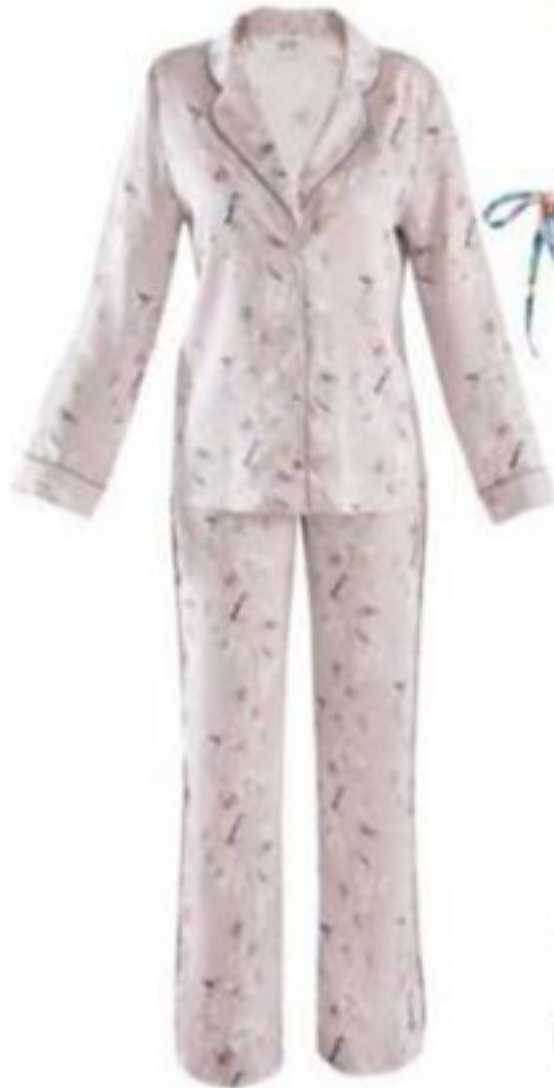
ELLİZ ₺ 789