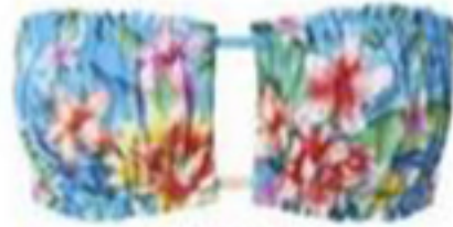
CALZEDONIA ÜST ₺ 199.90 ALT ₺ 149.90